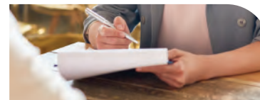
Assistant social du Travail