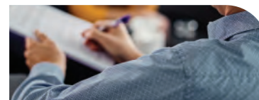
Psychologue du Travail