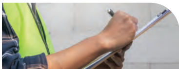
Technicien en Santé au Travail