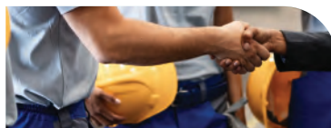
Technicien hygiène sécurité BTP