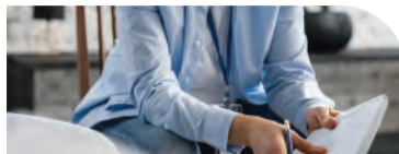
Infirmier en Santé au Travail