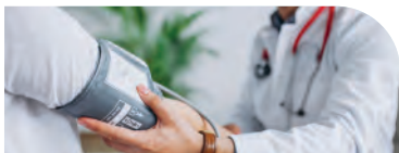
Médecin du Travail