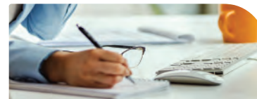
Secrétaire Médical & Assistant